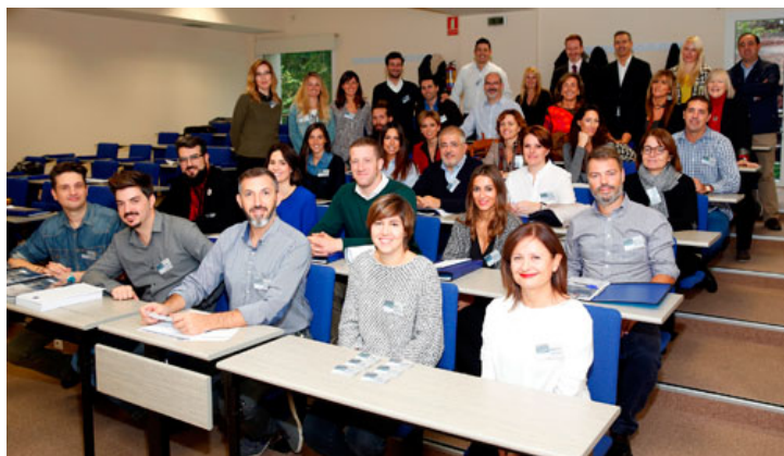
Los peluqueros, en la Business School.

Hoy se pone en marcha el primer programa de formación superior para la gestión de los salones de peluquería en España. Desarrollado por la escuela de negocios ESCP Europe y la marca líder de peluquería L'Oréal Professionnel , el programa Excelencia en Business de Salones de Peluquería tiene como objetivo prioritario lograr que los profesionales de la belleza cuenten con las mejores herramientas de gestión empresarial para conseguir la máxima rentabilidad de sus negocios.